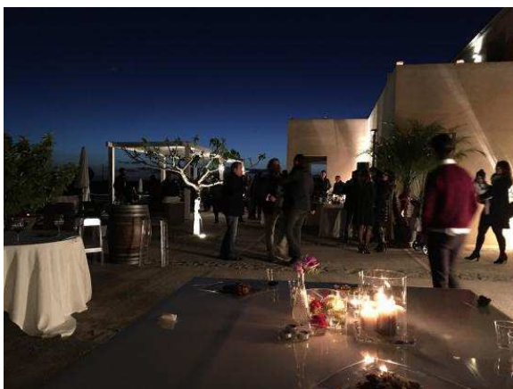
RELAIS CASINA MIREGIA Contrada Cinquanta 51 MENFI (AG) www.casinamiregia.it