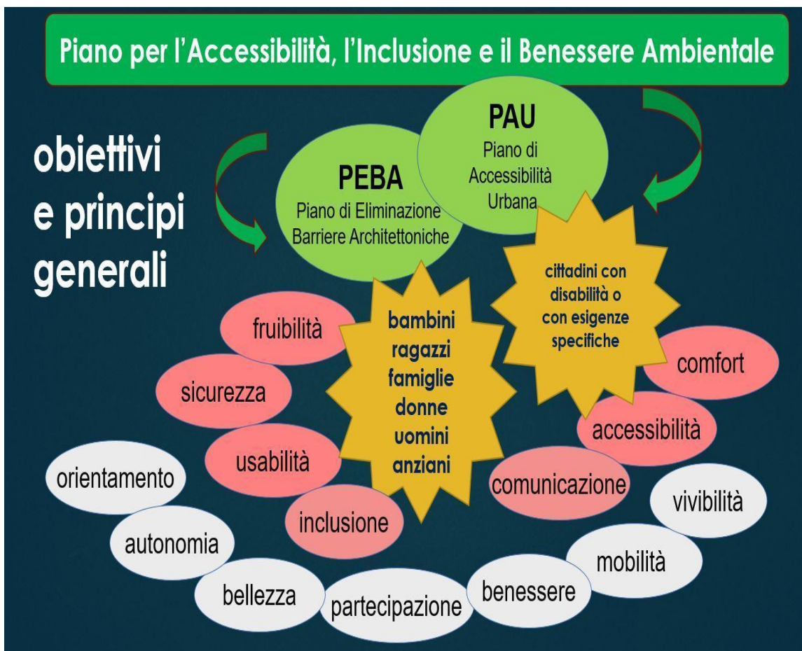
Fig. 1 – Obiettivi e principi